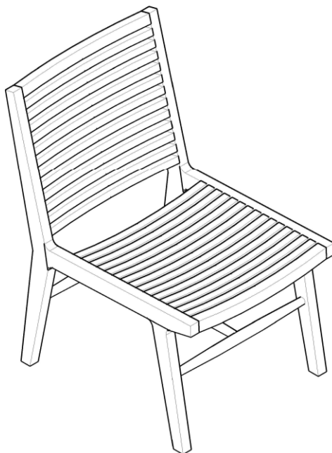
Description: Ribbon Lounge Chair Article number: 6056-444